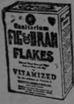
FIG & BRAN FLAKES