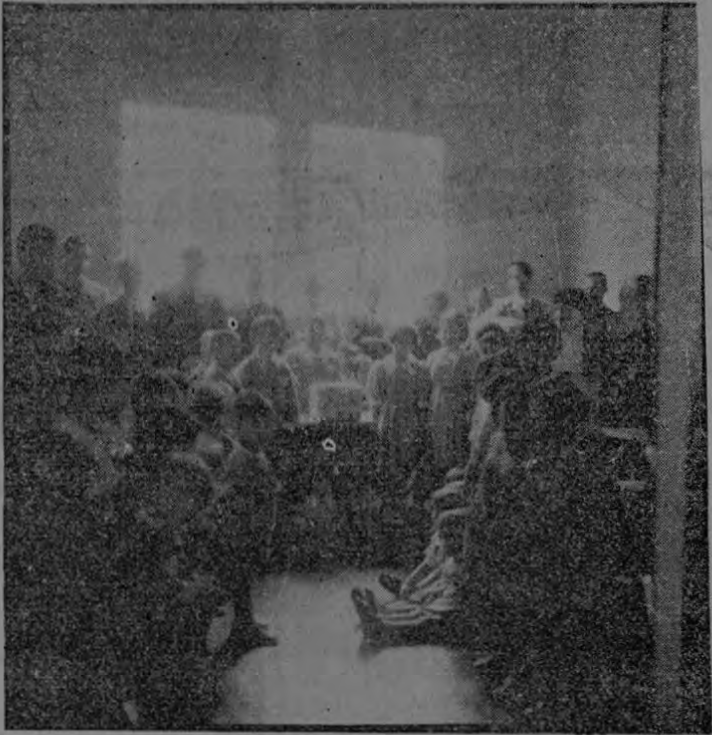
Gráficas de las visita que hicieron ayer al Sanatorio Durán los miembros del Instituto Cultural Costarricense Argentino, para obsequiar un hermoso aparato de radio a los niños asilados en aquel Sanatorio, llevándoles así horas de alegría.